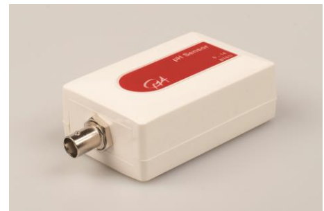
Figuur 1. De pH Sensor (BT61i).

De CMA pH sensor bevat een versterker waarmee een standaard combinatie pH elektrode (zoals de CMA pH Elektrode (031) kan worden uitgelezen door een laboratorium interface. De pH elektrode wordt aangesloten op de pH versterker via een BNC connector die zich bevindt aan het uiteinde van de sensordoos. De pH versterker past de door de pH elektrode geproduceerde spanning aan naar een bereik tussen 0 en 5 V, die door de interface kan worden gemeten.