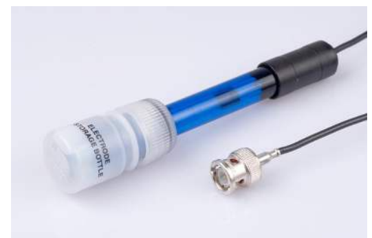
Figuur 2. De pH Elektrode (031).

De CMA pH elektrode is ontworpen om metingen in het pH bereik tussen 0 en 14 te doen. Deze bevat een kabel met een BNC connector. De elektrode (van glas) is geplaatst in een plastic pijpje met een opening aan de onderzijde. Hij wordt geleverd in een fles die gevuld is met een